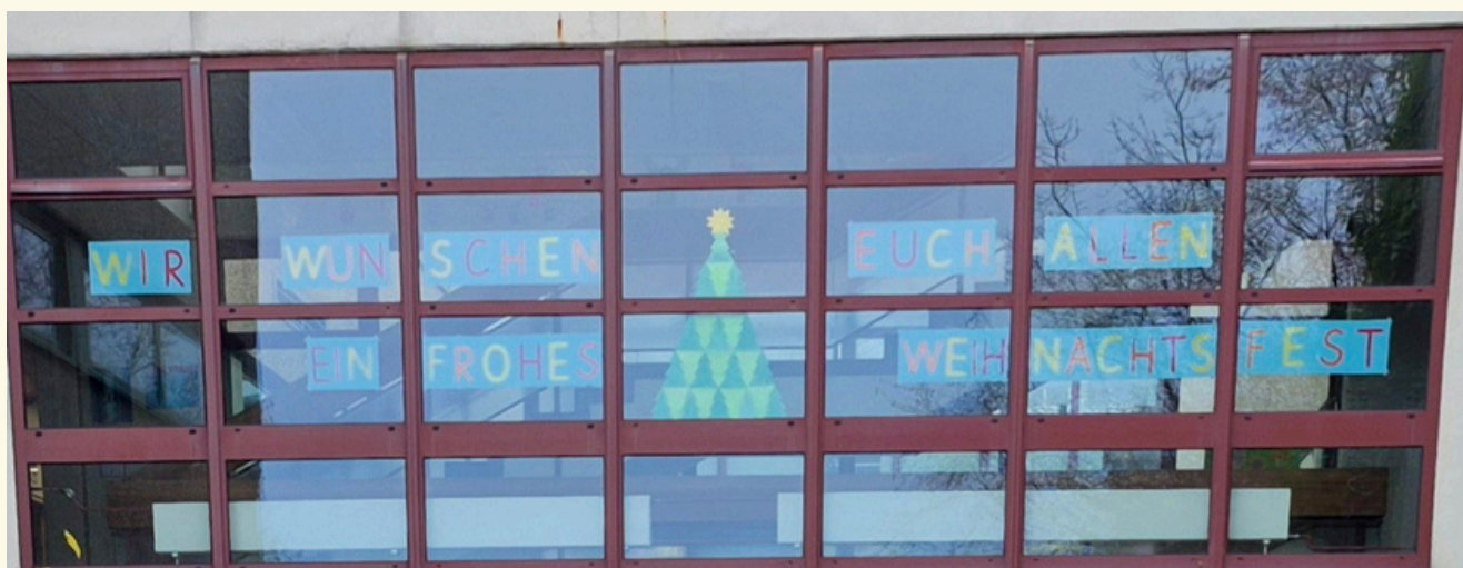
Schulhausgestaltung Klasse 1a